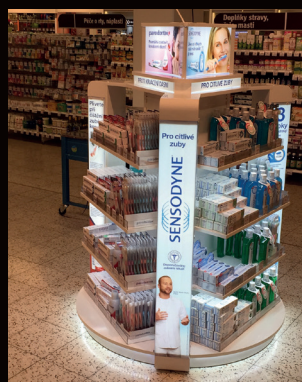
Ukázka přehledných a srozumitelných POP médií / Zdroj: Fotoarchiv autora