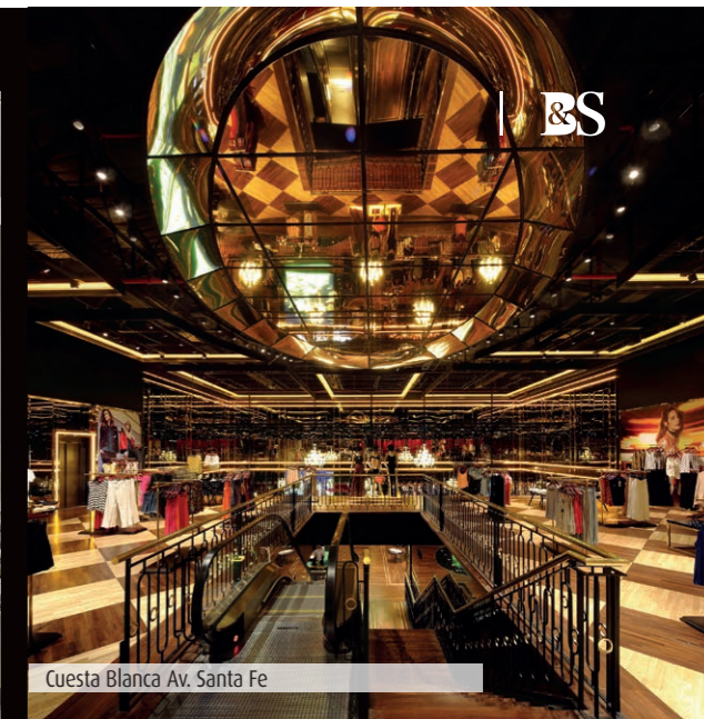
Cuesta Blanca Av. Santa Fe