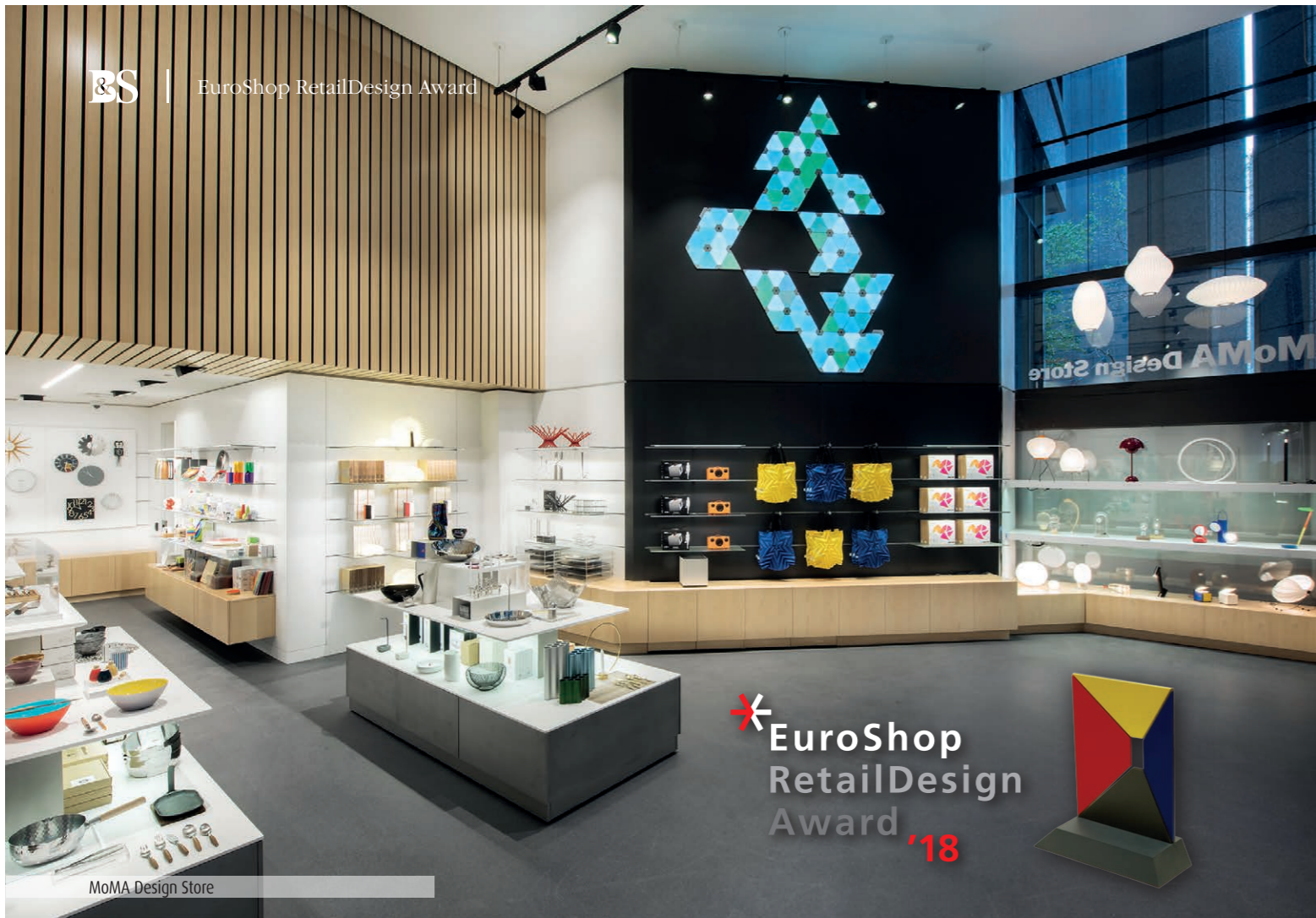
MoMA Design Store