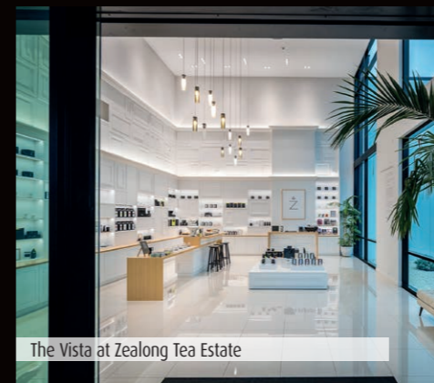
The Vista at Zealong Tea Estate