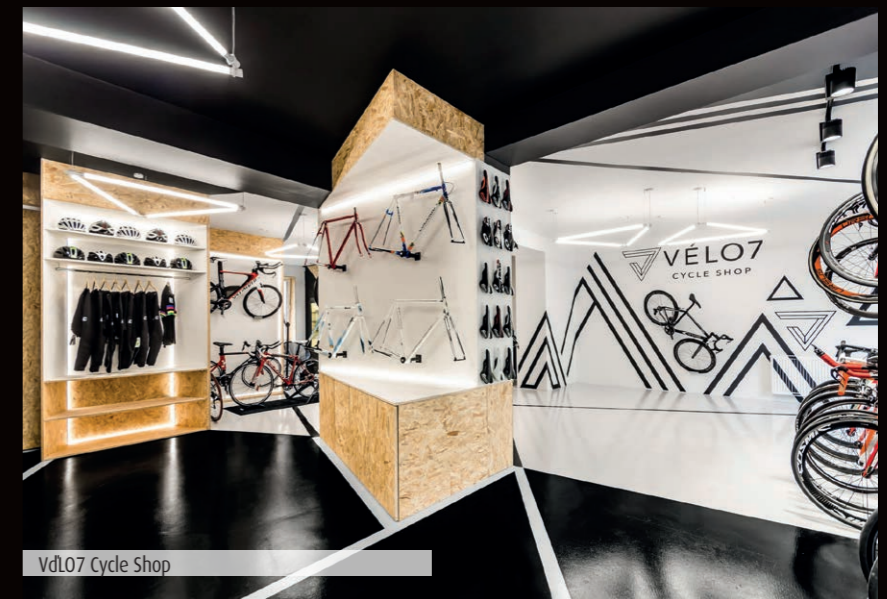
VdL07 Cycle Shop

35 těch nejúspěšnějších se letos dostalo do užší nominace. Ceny EuroShop RetailDesign Awards budou předány zástupci EHI a Messe Düsseldorf třem nejlepším konceptům světa na slavnostním večeru 26. dubna zahajujícím veletrh C-Star v Šanghaji.