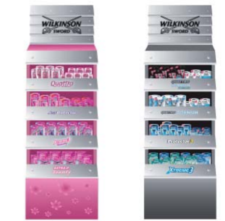
Stojan určený pro dámské systémové a jednořezové holení

Petra Křivánková Ostravská univerzita, Fakulta umění